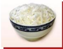
140g bánh phở