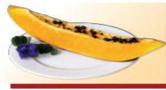
200g đu đủ