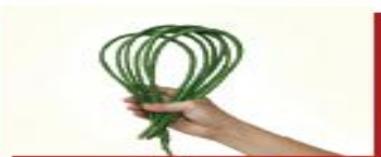
50g đậu đũa