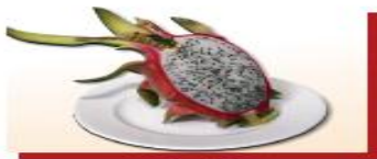
250g thanh long