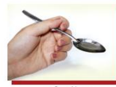
Muỗng dầu ăn

1 đơn vị thực phẩm chứa lượng chất béo tương đương với 5g