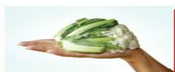
100g bông cải