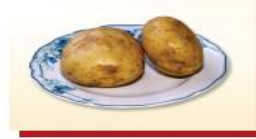
200g khoai tây