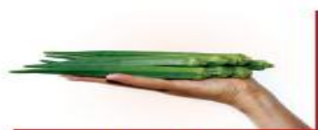
100g đậu bắp