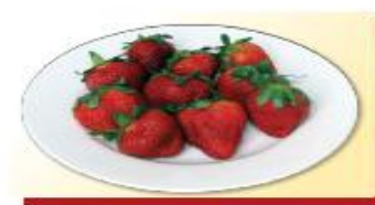
150g dâu tây