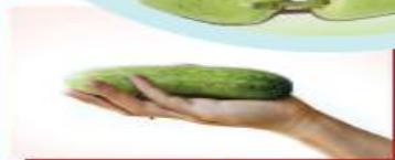
150g dưa leo