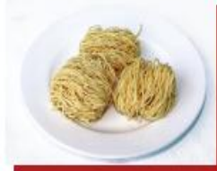
60g mì sợi

1 đơn vị thực phẩm chứa lượng bột đường tương đương 45 g