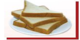
2.5 lát bánh mì