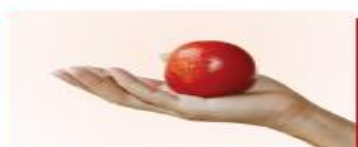
120g cà chua