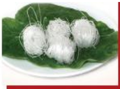
50g bún khô