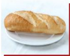
80g bánh mì